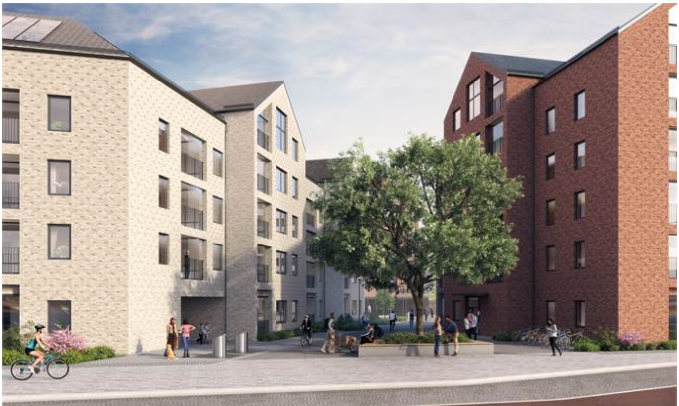
Visionsbild Nya Saftstationen