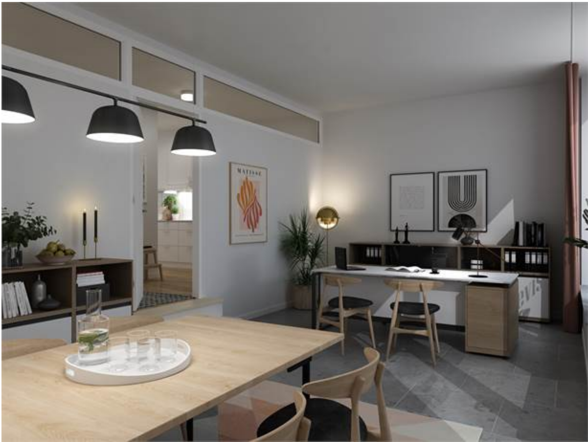
Visionskiss över hur kontorsdelen i denna 93 kvm "bokal" kan nyttjas. Främre delen är kontor, genom dörren skymtas köket i den privata lägenheten.