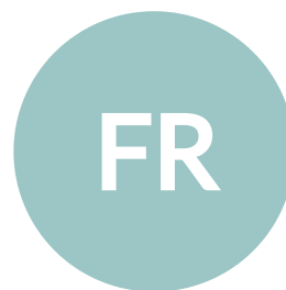
Frida Raeburn Uthyrning

Se hela annonsen här: objektvision.se/Beskriv/198028485 eller scanna QR-koden